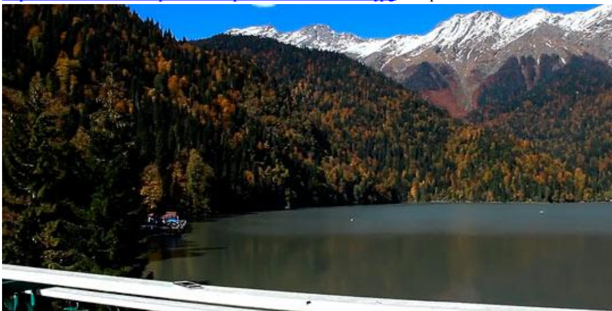
http://obzorurokov.ru/abxaziya/ozero-rica.html Озеро Рица