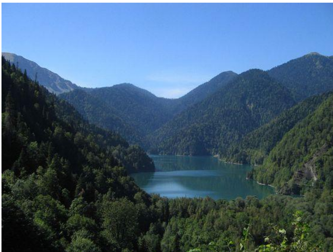
Озеро Рица с водой малахитового цвета

Оно избрало себе место в ущелье Лашипсы на высоте 1000 м. над уровнем моря в окружении трёх заснеженных гор-исполинов. Это место окутано десятками легенд, оно в песнях. Но лучше 1 раз увидеть, чем сто раз услышать!