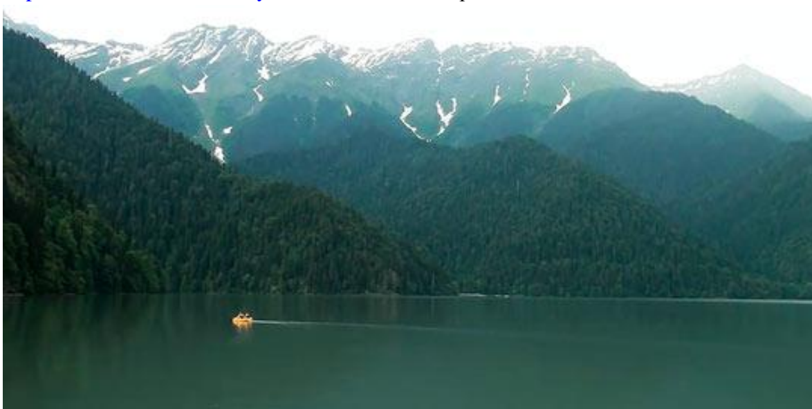
http://obzorurokov.ru/wp-content/uploads/2011/02/riza2.jpg Озеро Рица