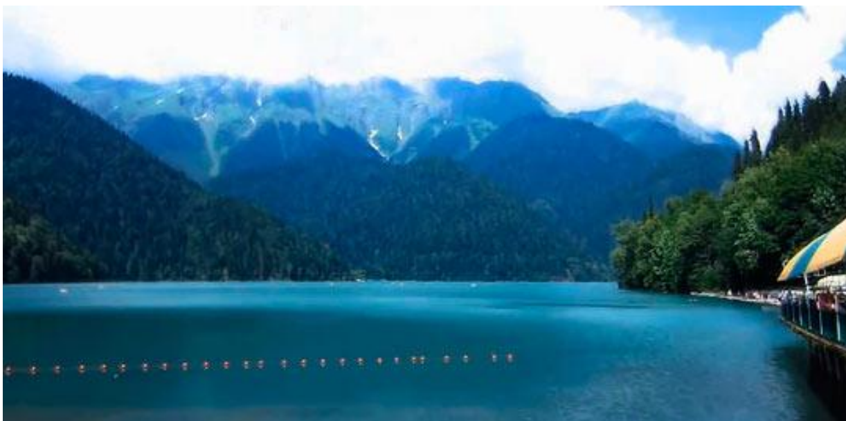
http://obzorurokov.ru/wp-content/uploads/2011/02/riza3.jpg Озеро Рица